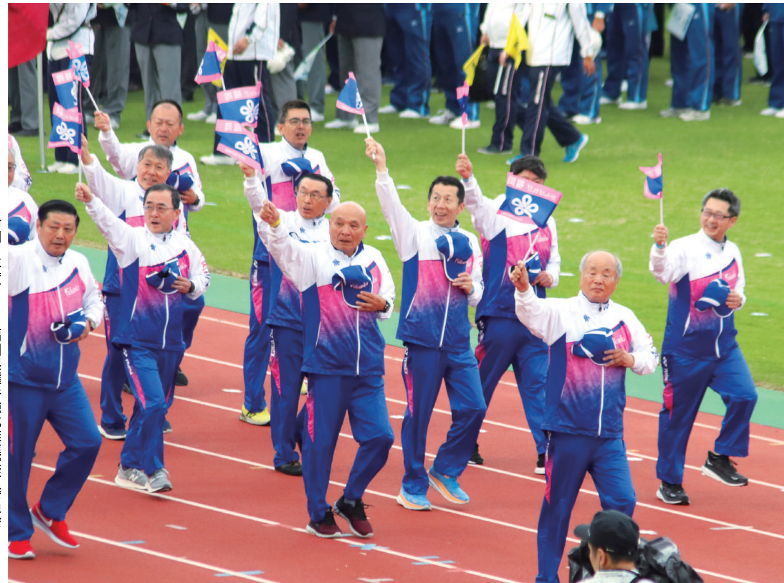
福岡県選手強化推進実行委員会