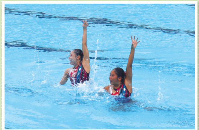
アーティスティックスイミング