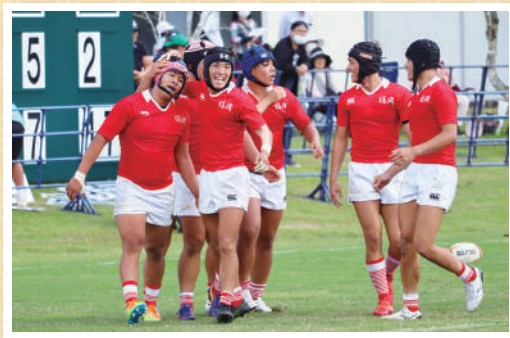
ラグビーフットボール