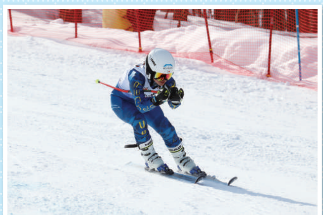
スキー(ジャイアントスラローム)