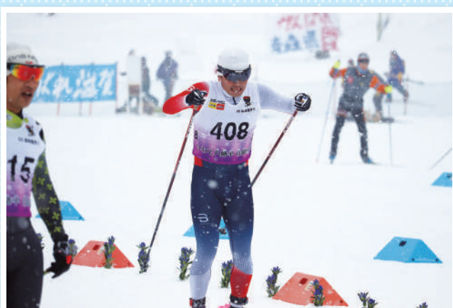
スキー(クロスカントリー)