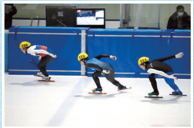
スケート(ショートトラック)