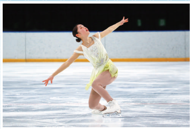
スケート(フィギュア)