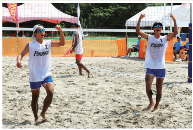
ビーチバレーボール