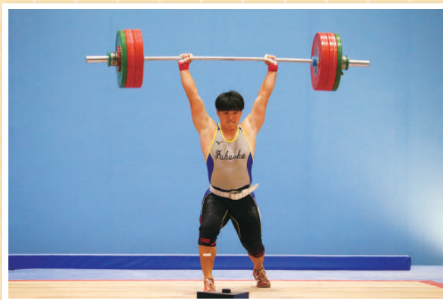
ウエイトリフティング