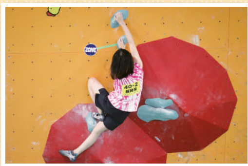
スポーツクライミング