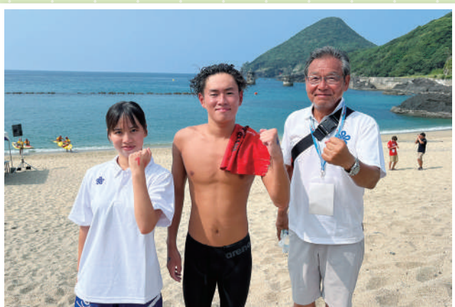
オープンウォーター