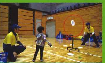
フライングディスク 12/11 13:30~15:30 12/12 10:30~12:30