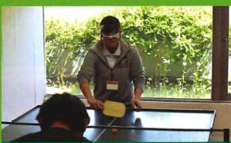
サウンドテーブルテニス 12/11 13:30~15:30 12/12 10:30~12:30