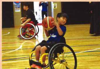
車いすバスケットボール 13:30~15:30