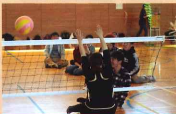
シッティングバレーボール 10:30~12:30