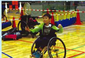
パラバドミントン