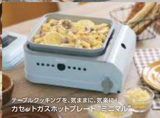
テーブルクッキングを、気ままに、気楽に! カセットガスホットプレート“ミニマル”