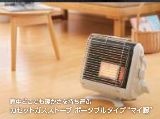
家中どこでも暖かさを持ち運ぶ カセットガストーブ ポータブルタイプ“マイ暖”