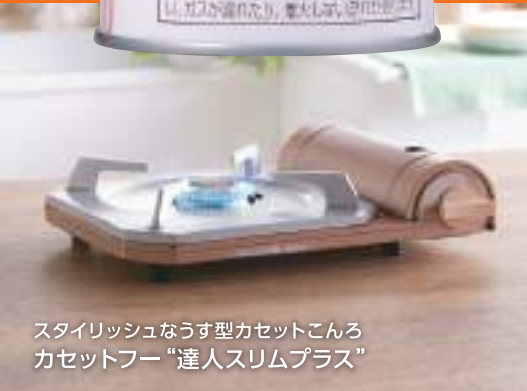
スタイリッシュなうす型カセットこんろ カセットフー“達人スリムプラス”