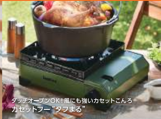
タッチオープンOK! 風にも強いカセットこんろ カセットフー“タフまる”