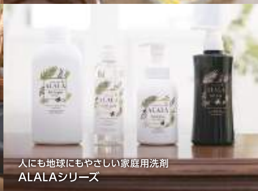
人にも地球にもやさしい家庭用洗剤 ALALAシリーズ