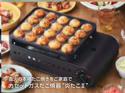
直火の本格たこ焼きをご家庭で カセットガスたこ焼き器“炎たこⅡ”