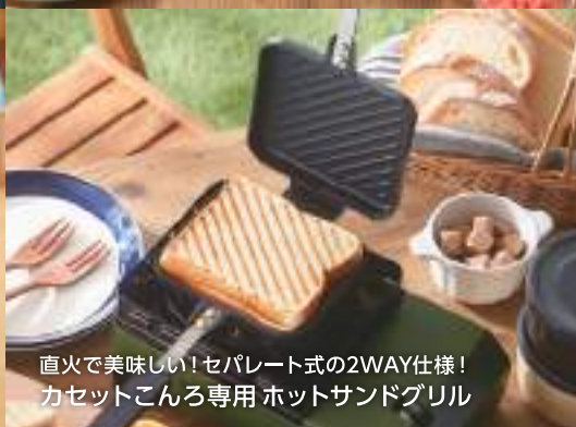
直火で美味しい! セパレート式の2WAY仕様! カセットこんろ専用 ホットサンドグリル