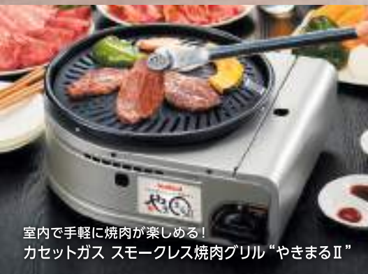
室内で手軽に焼肉が楽しめる! カセットガス スモークレス焼肉グリル“やきまるⅡ”