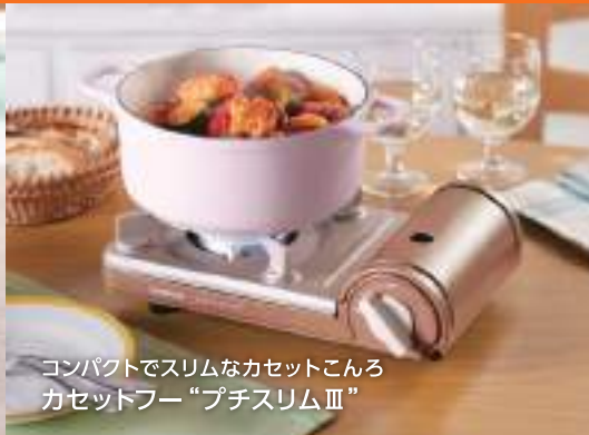
コンパクトでスリムなカセットこんろ カセットフー“プチスリムⅢ”