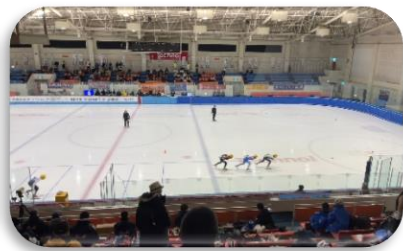
テクノルアイスパーク八戸