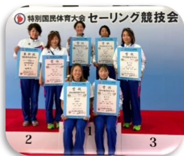
【セーリング競技 入賞者】