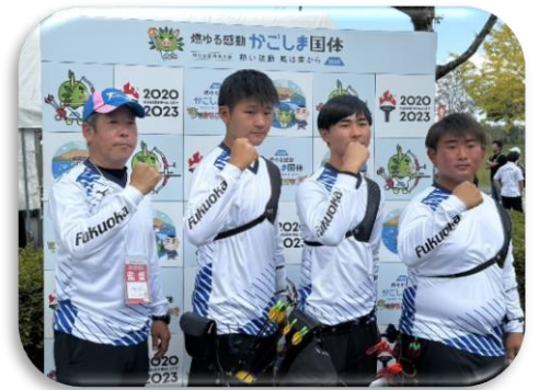
【アーチェリー競技 少年男子】

また、成年女子、少年女子も予選リーグを突破し、5位入賞を果たした。 (競技別総合成績 3位 )