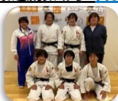
柔道競技女子チーム

ユウケイ武道館(宇都宮市)にて行われた柔道競技。女子は準々決勝で滋賀県と対戦し、1-1から代表戦の末に惜敗。