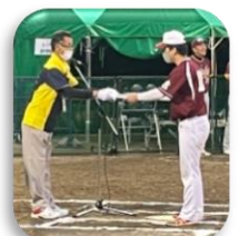
成年男子の表彰式